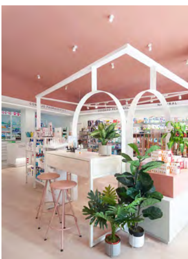
FARMACIA SAN GABRIEL