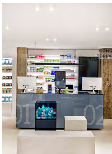
FARMACIA TOP FARMA