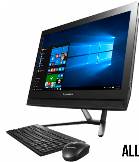
ALL IN ONE