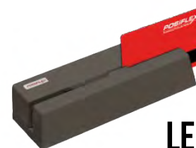
LECTOR DE TARJETAS