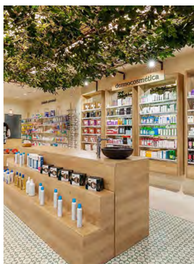
FARMACIA LAS HADAS